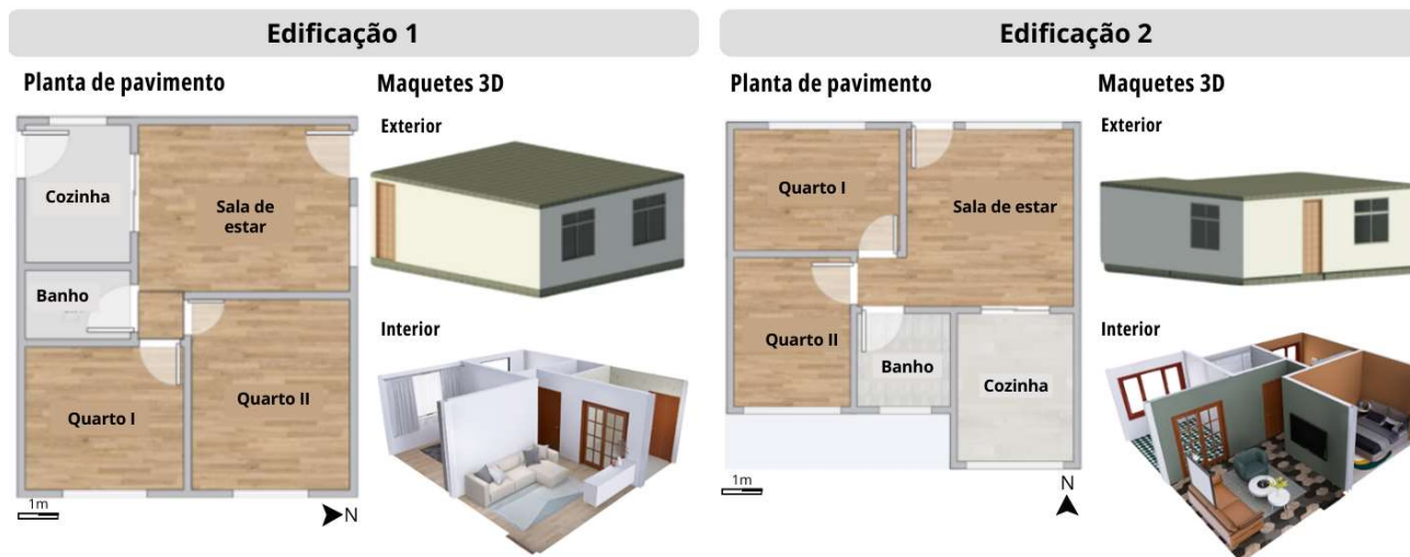
Figura 1: Edificação e sistemas analisados

detalhamento por estado. As emissões utilizadas neste estudo foram calculadas a partir das médias dos intervalos apresentados pelo SIDAC.