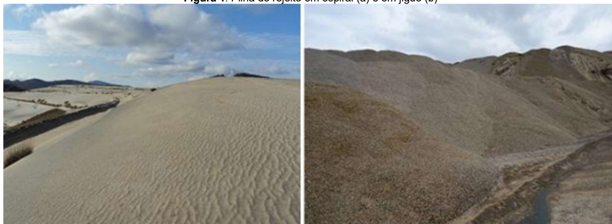
Figura 1: Pilha de rejeito em espiral (a) e em jigue (b)