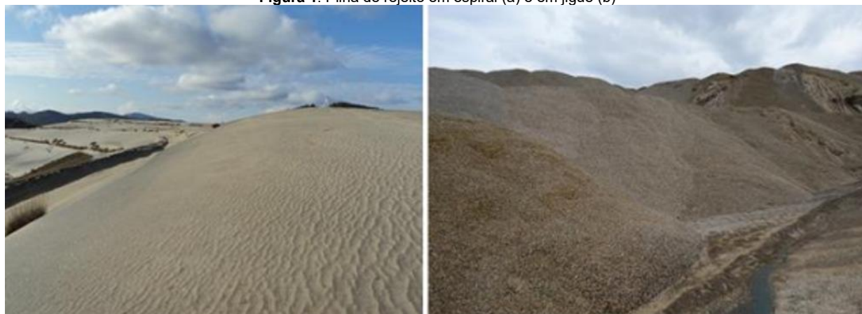
Figura 1: Pilha de rejeito em espiral (a) e em jigue (b)

antecedência, permitindo o equilíbrio térmico da mistura, uma vez que a reação é exotérmica. A ordem de adição dos componentes seguiu recomendações técnicas para garantir homogeneidade.