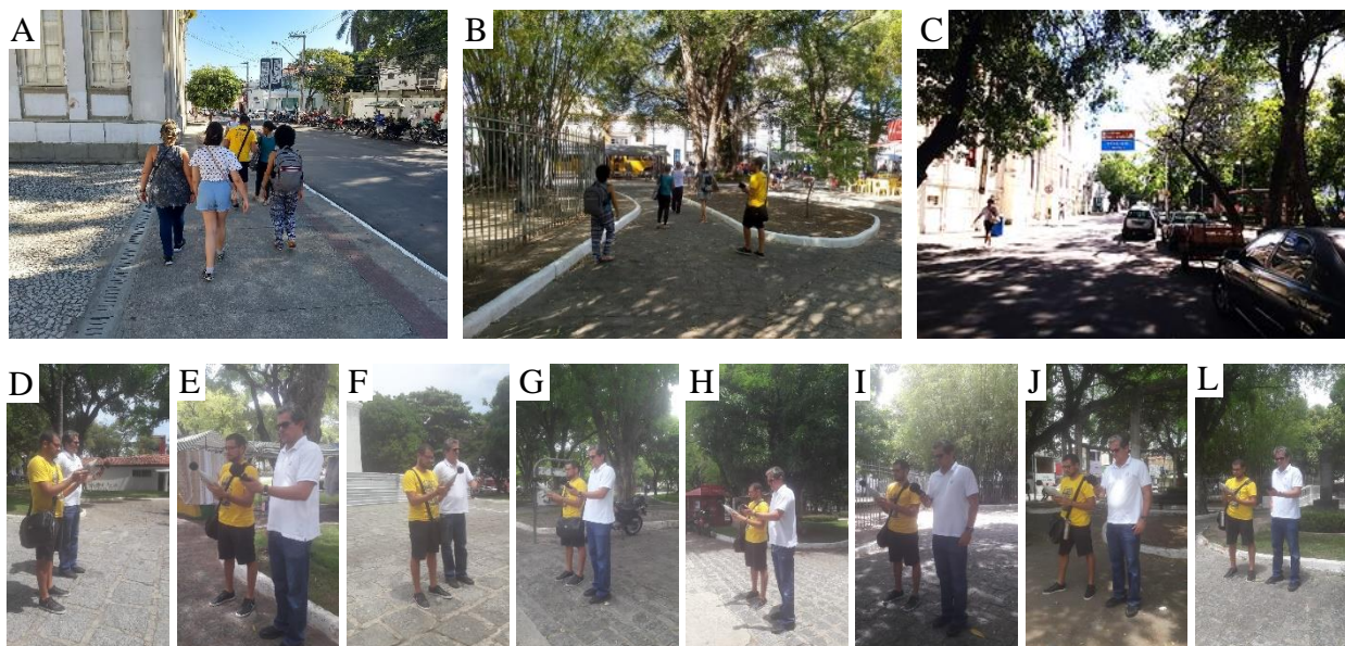
Figura 3 - Fotos: A, B, C (acima) - Visita in loco em 6 de dezembro de 2019 para análise exploratória do lugar (da esquerda para direita): A - Caminhada na calçada da Praça Almirante Barroso ao longo da rua Itabaiana, lado leste da Praça Olímpio Campos; B – Nas proximidades do Ponto 9, no fundo da Catedral Metropolitana de Aracaju; C - Lado sul da Praça Olímpio Campos ao longo da rua Itaporanga. Fotos D a L (abaixo) - Medições acústicas e gravações de áudios nos pontos P3, P4, P6, P7, P8, P10, P11, P12, respectivamente.