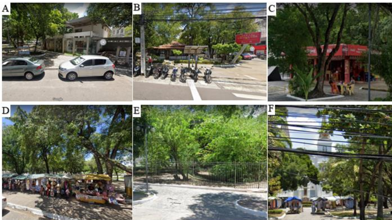
Figura 4 – Imagens da Praça Olímpio Campos, com destaque para algumas edificações, barracas de artesanato e elementos paisagísticos (espelho d'água, vegetação) – Imagem A: Galeria de Artes Álvaro Santos. Imagem B: Cacique Chá Bistrô. Imagem C: Restaurante “Ponto do Coelho”. Imagem D: Barracas de artesanato. Imagem E: Espelho d'água e vegetação. Imagem F: Barracas de artesanato (primeiro plano) e Catedral Metropolitana de Aracaju (ao fundo).

A Praça Olímpio Campos data da segunda metade do século XIX, em decorrência da construção da Igreja Matriz de Nossa Senhora da Conceição, atual Catedral Metropolitana de Aracaju (MARIA DE JESUS e CARMO, 2014). Ao longo de sua existência, a praça sofreu diversas intervenções físicas e nas suas funções. Atualmente, a Praça Olímpio Campos possui elementos esculturais, arquitetônicos e paisagísticos, especialmente, espelho d'água, canteiros, gramados e arbóreos que garantem abrigo para algumas espécies de pequenos animais, além de espaços sombreados para os seus usuários, marcando a paisagem e remetendo a sua história. Além da Catedral Metropolitana de Aracaju, a praça abriga o “Cacique Chá Bistrô” e o restaurante “Ponto do Coelho”, a Galeria de Artes Álvaro Santos, além de quiosques de lanches, barracas de artesanato itinerantes, bancas de revistas, pontos de parada de táxi e de ônibus (Figura 4).