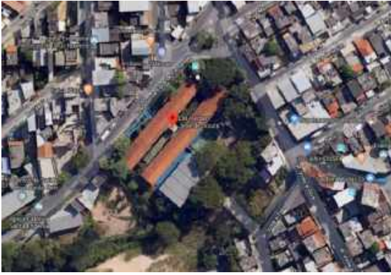
Figura 1 - Imagem satélite da localização da EM