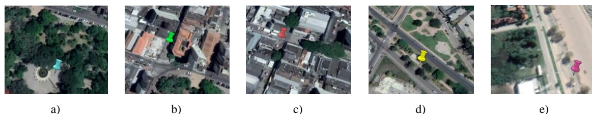
Figura 2: visualização aérea dos locais de análise.