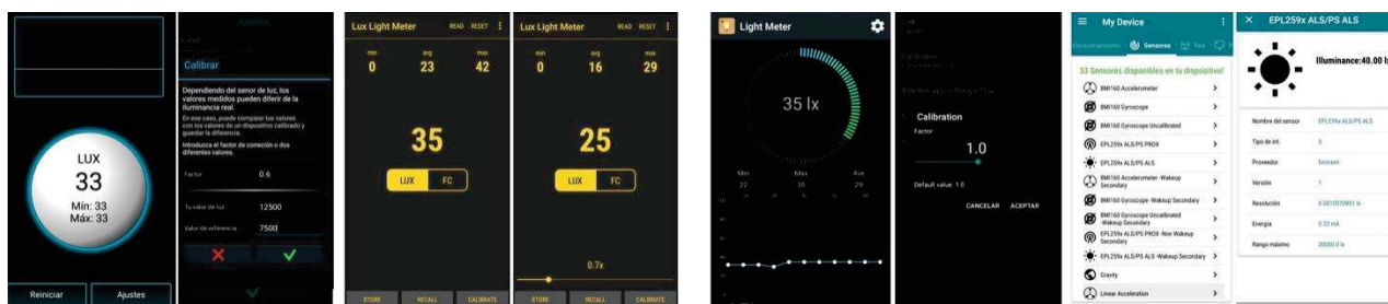
Figura 2 - Descripción de las aplicaciones de medición de iluminancia relevadas. De izquierda a derecha: Luxómetro Crunchy ByteBox; Lux Light Meter Free; Luxómetro My Mobile Tools: My Device-Device Info

Por su parte, la Figura 2 muestra capturas de pantalla de las aplicaciones seleccionadas, tanto de su interfaz de lectura de iluminancia como la de calibración de iluminancia.