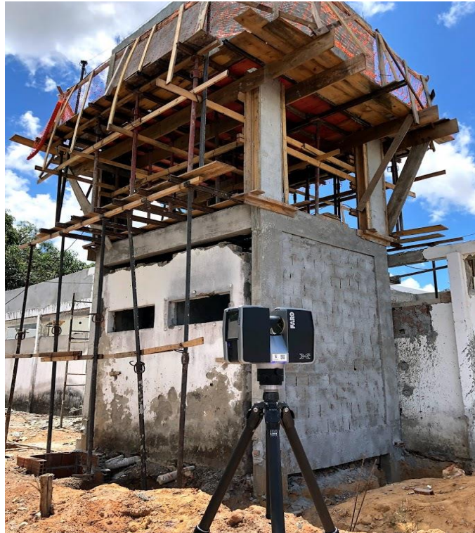
Figura 1 – Laser Scanner utilizado pelo órgão

Para a captura dos dados espaciais da obra foi utilizado um equipamento de posse do próprio órgão, o Laser Scanner modelo FOCUS3D X 130, da fabricante FARO®, como mostra a Figura 1.