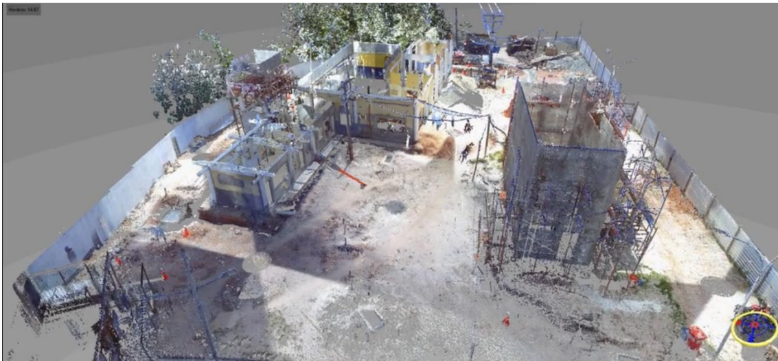
Figura 3 – Nuvem de pontos processada