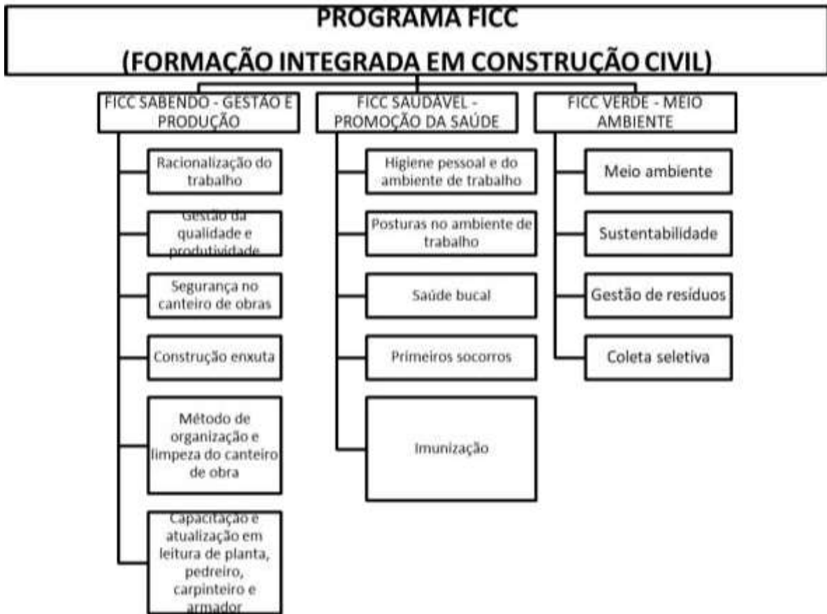
Figura 1 – Estruturas do Programa FICC