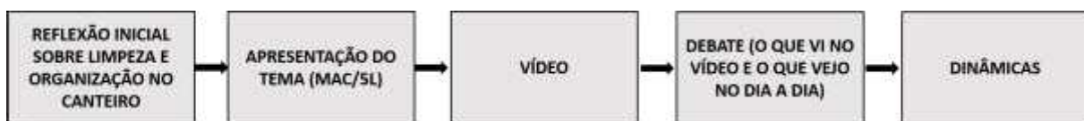
Figura 2 – Estruturas das oficinas

A estrutura das oficinas é sintetizada na Figura 2 a seguir: