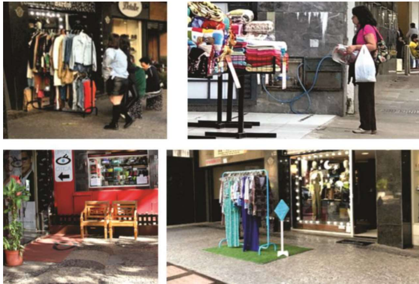
Figura 3 – Elementos semi-fixos nos recuos frontais

peças de arte etc., influencia significativamente na vitalidade das ruas em estudo, ao reterem as pessoas por mais tempo no espaço (Figura 3).