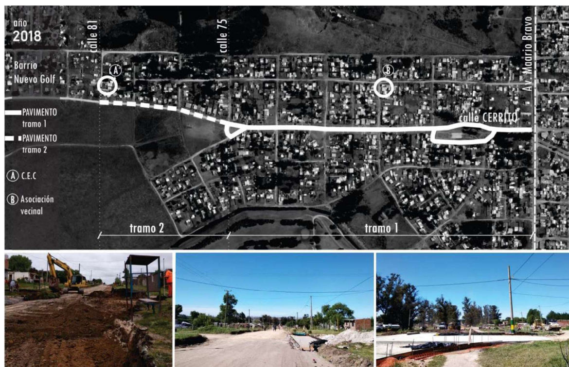
Figura 6. Etapas de la pavimentación calle Cerrito