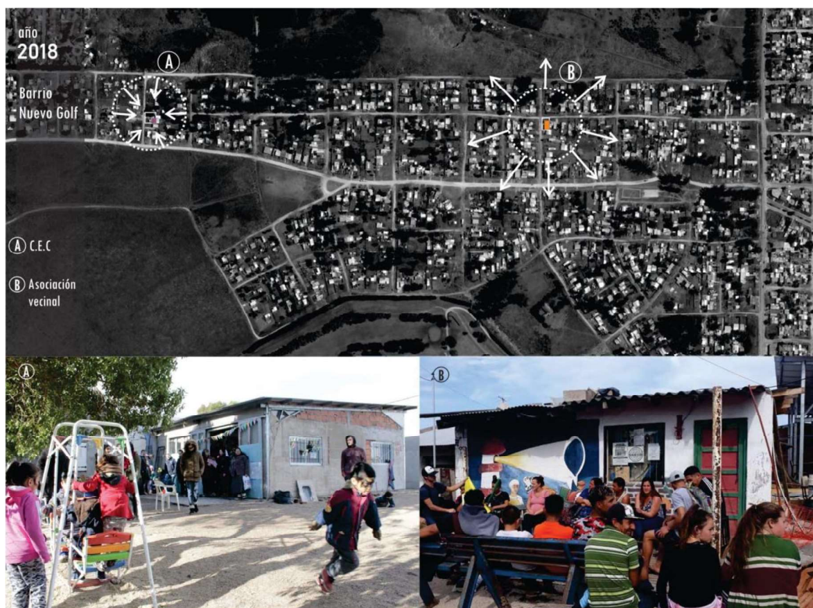
Figura 4. Actores y espacios relevantes