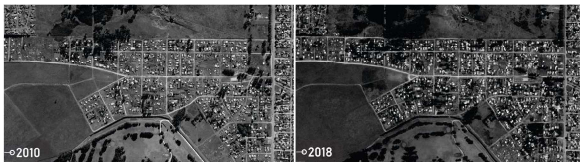
Figura 2. Corte temporal 2010-2018

proceso de densificación del asentamiento, especialmente en las manzanas contiguas a la arteria principal (fig. 2).