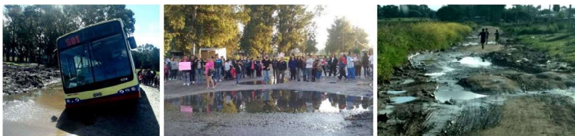
Qué, periodismo en la calle. Noviembre de 2017: "Cancelan líneas de colectivo en Barrio Nuevo Golf", El marplatense. Abril de 2018: "Barrio Nuevo Golf: sin servicio de micros por el estado de las calles", La Capital.

En relación con los servicios urbanos, en la infraestructura y el saneamiento, existen graves carencias, donde las redes de gas y cloacas son inexistentes. La red de agua comienza a ser construida en 2010, sin embargo, el servicio aún es deficiente y precario, al igual que la red de electricidad, que presenta numerosas conexiones clandestinas. El transporte público ingresa recién en 2015 a partir de constantes reclamos de los vecinos. Sin embargo, la accesibilidad vehicular es perjudicada por las condiciones de las calles, tanto para el transporte público como la recolección de residuos o posibles emergencias (fig. 3)2.