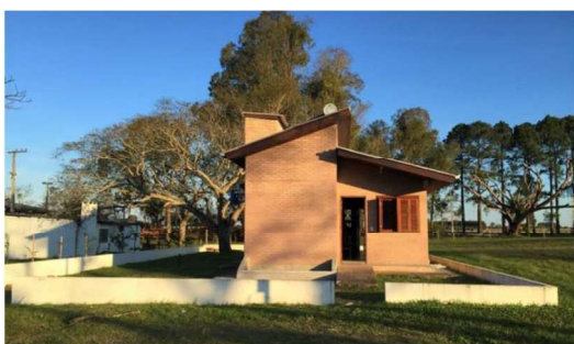
Figura 1. Perspectiva frontal da Casa Popular Eficiente

A Casa Popular Eficiente (CPE), demonstrada nas Figuras 1 e 2, é um protótipo de habitação de interesse social (HIS) construído no Campus Sede da Universidade Federal de Santa Maria (UFSM), utilizando materiais e soluções sustentáveis, como tijolos de solo-cimento, telhas onduladas Tetra Pak, impermeabilizantes ecológicos, tintas de terra, entre outros (VAGHETTI et al., 2013). Ainda, foram implantadas medidas passivas de condicionamento térmico, reaproveitamento da água da chuva, aquecimento solar da água de banho e tratamento in loco das águas cinzas, buscando minimizar os impactos ambientais causados pela produção de energia elétrica e destinação de efluentes (VAGHETTI et al., 2013).