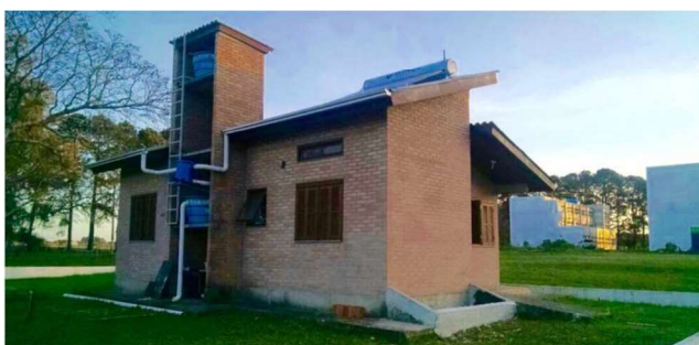
Figura 2. Perspectiva lateral da Casa Popular Eficiente

Resultado de uma extensa pesquisa iniciada em 2008 na Universidade Luterana do Brasil (ULBRA Santa Maria/ Curso de Arquitetura e Urbanismo) e continuada pelo Grupo de Estudos e Pesquisas em Tecnologias Sustentáveis (GEPETECS) do Curso de Engenharia Civil da UFSM, o protótipo, foi inaugurado em 2013, demonstrando a possibilidade e viabilidade da construção de HIS que contemple em sua integridade soluções econômicas e ecologicamente sustentáveis (VAGHETTI; SANTOS; CARISSIMI, 2015).