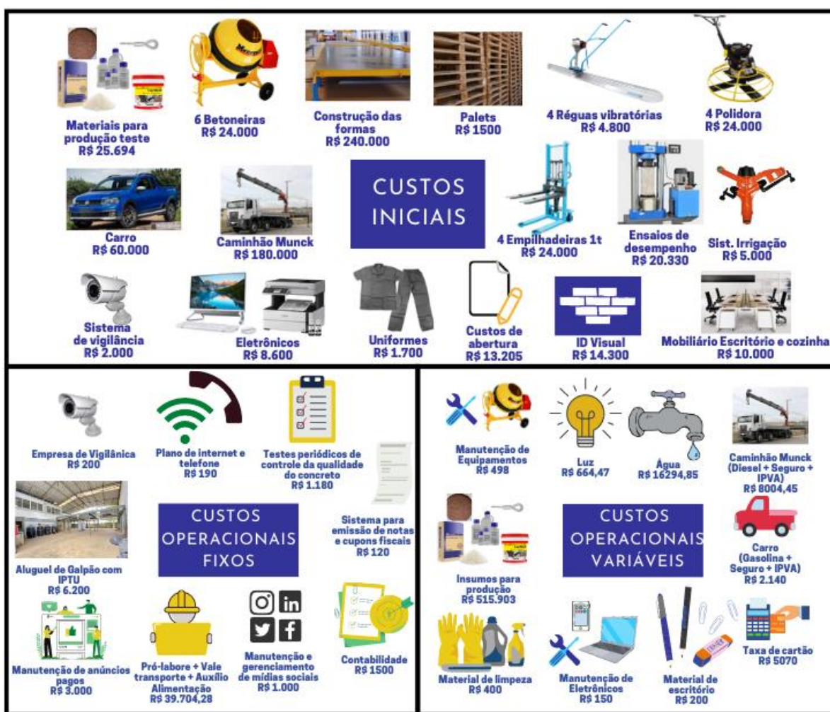
Figura 3. Composição dos custos de produção dos painéis geopoliméricos

se que os usuários estão dispostos a pagar até 15% a mais em um produto que seja mais sustentável. Diante desta informação, o painel geopolimérico tem maior competitividade ao ter seu preço comercial igualado ao de seu principal concorrente.