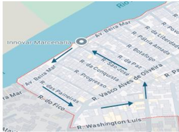
Figura 2. Percurso da caminhada no bairro Dom João

Assim, os voluntários seguiram o percurso a pé, e relataram ao pesquisador (com registros gravados), suas observações e comentários sobre as condições físicas de cada local e da iluminação pública. A etapa final consistiu na transcrição das gravações, seleção de fotografias e análise dos resultados sobre as condições oferecidas pela iluminação pública na comunidade.