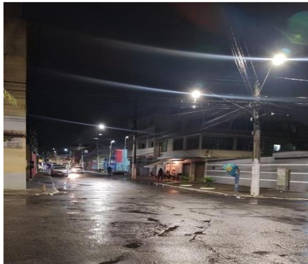
Figura 3: Vista da quadra de esportes iluminada.

A primeira etapa do trabalho de campo consistiu na entrevista com a liderança da comunidade. Na etapa seguinte, um dos pesquisadores (arquiteto e light-designer) fez a pé o trajeto delineado a partir da rua São José, de acesso principal à comunidade. Ocasão em que pôde constatar a presença marcante da quadra de esportes e sua potente iluminação, Figura 3. A iluminância horizontal aferida foi de 138 lx no centro da rua, 30 lx na calçada do lado direito onde os postes estão instalados e 7 lx na calçada do lado esquerdo, contrário ao poste de iluminação. Observa-se que a rua é asfaltada e tem uma faixa de trânsito aproximada de 9,00m.