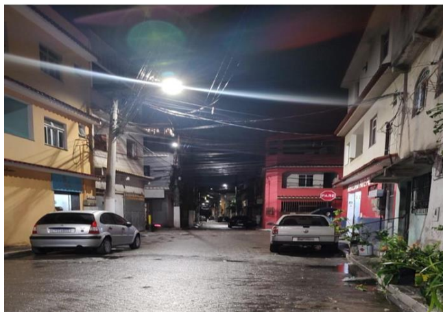
Figura 4: Cruzamento da Rua São José com a Rua Vasco Alves de Oliveira

ofuscamento para os pedestres, Figura 4. Porém, após cruzar a Rua Vasco Alves de Oliveira é possível visualizar na Rua São José, o contraste e a hierarquia de vias sendo definida pela luz. Neste novo trecho a largura da faixa de trânsito reduz-se pela metade, e as luminárias LED são de 60W de potência, também no alto dos postes.