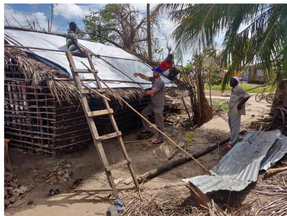
Figura 3: Reconstrução após o ciclone Kenneth.