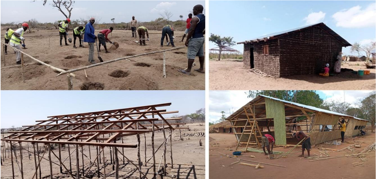
Figura 5: Participação comunitária na construção de habitações em Mecufi e escola em Chiure. Fonte: Adaptado de Rahanito Antumane (2024) e Paulo Damião Huo (2024).

Houve destaque para o uso de tecnologias sociais, principalmente quando combinadas com capacitação das comunidades. Técnicas como taipa de mão, reboco com argamassa e reforço com arames, varões de aço para unir as estacas com a estrutura da cobertura, foram citadas como elementos de inovação resiliente. No que concerne às soluções identificadas e suas características, destacam-se o uso da taipa mão e bambu tratado, que são métodos tradicionais que garantem estabilidade e conforto térmico. A cobertura em zinco com reforço estrutural (madres de madeira, varão de aço e arames), mostrou eficácia mesmo após novos ciclones.