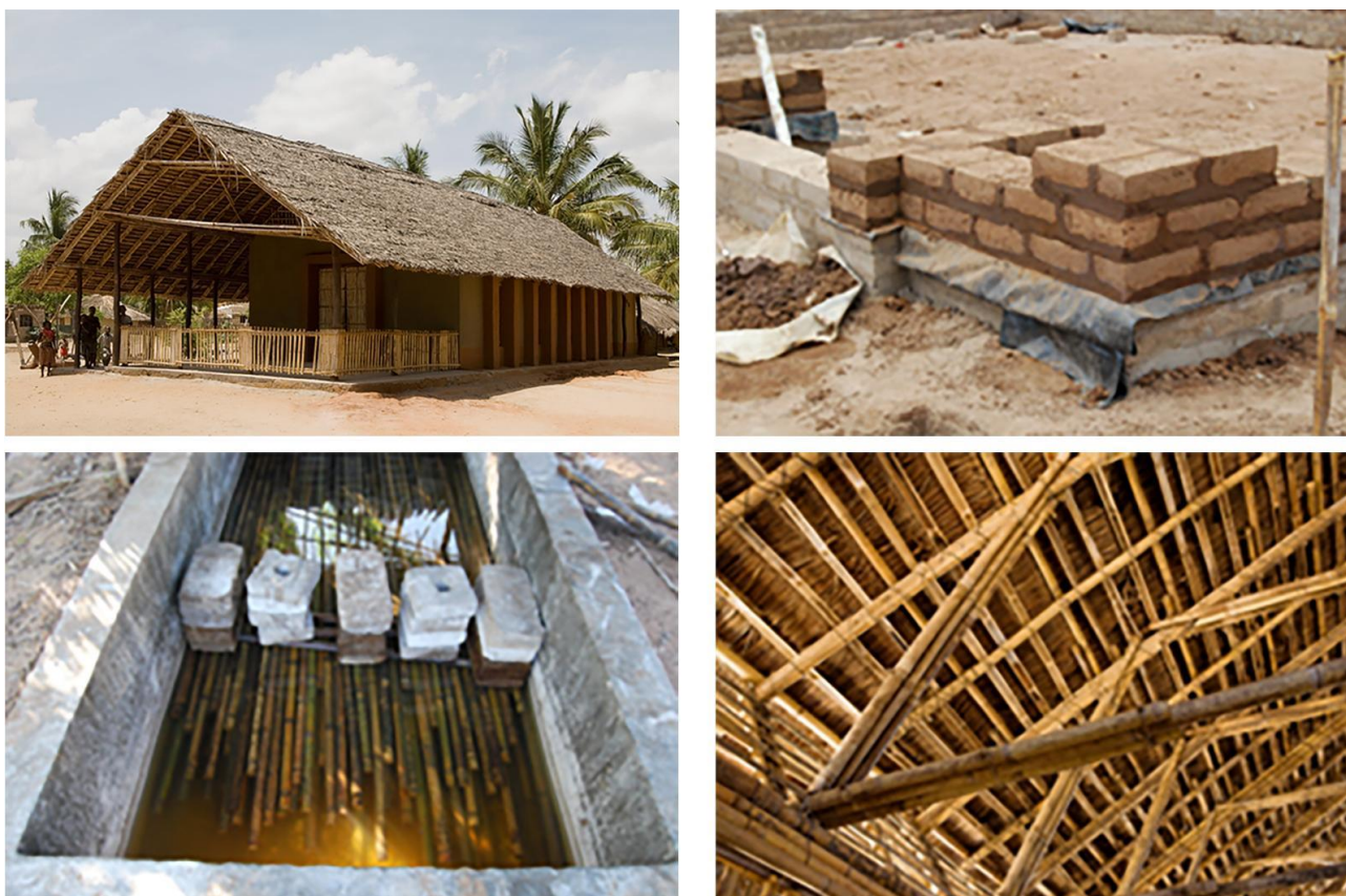
Figura 4: Diferentes fases da implementação do projeto piloto, Escola Básica 25 de Junho.

Como materiais e técnicas inovadoras na construção sustentável, em algumas construções, a província de Cabo Delgado, segundo Ziegert et al. (2011), tem usado como materiais locais, o adobe estabilizado, tijolos ecológicos, bambu tratado e bioconstrução na reconstrução resiliente em Cabo Delgado. O bambu, por exemplo, está sendo utilizado na construção de telhados e vigas devido à sua resistência e disponibilidade local. Os mesmos autores, afirmam que os projetos executados demonstram que a utilização de técnicas locais combinadas com inovação pode reduzir significativamente os custos da construção, tornando-a acessível para as comunidades de baixa renda.