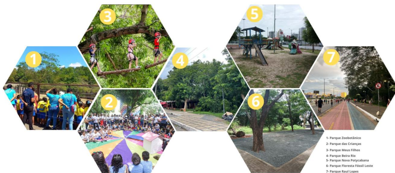
Figura 1 - Eixos atrativos dos seis principais Parques Ambientais de Teresina - Zona Leste

além de promover o uso sustentável dos espaços verdes e incentivar a prática do lazer, consolidando uma abordagem recorrente em Teresina. Atualmente, na Zona Leste possui 12 parques existentes, isto é um aumento de um parques, dos quais 7 se destacam por suas características ribeirinhas e seus eixos atrativos específicos: o Parque Zoobotânico (familiar, comercial e educativo), o Parque das Crianças (infantil), o Parque Meus Filhos (infantil, comercial e esportivo), o Parque Raul Lopes (comercial/esportivo), o Parque Beira Rio (comercial e esportivo), o Parque Nova Potyabana (cultural e esportivo) e o Parque Floresta Fóssil Leste (educacional) (Figura 1).