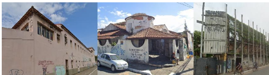
Figura 3: Edificações integrantes do SPH que se encontram abandonadas ou em ruínas (Da esquerda para a direita: Hotel Imbetiba, Clube Ypiranga, Palácio dos Urubus). Fonte: Google Maps 2023 e autor – Montagem do autor

Os bens integrantes do SPH são os únicos a contar com alguma forma de reconhecimento institucional e, ainda assim, muitos deles encontram-se em estado de abandono e sem manutenção adequada (como o Clube Ypiranga, o Cine Clube e o Hotel Imbetiba) ou mesmo em ruínas, como é o caso do Palácio dos Urubus (Figura 3).