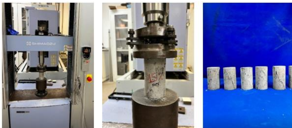
Figura 3: Equipamento da marca Shimadzu, modelo AG – 100 kN.

A resistência à compressão dos corpos de prova foi obtida a partir da equação 1: