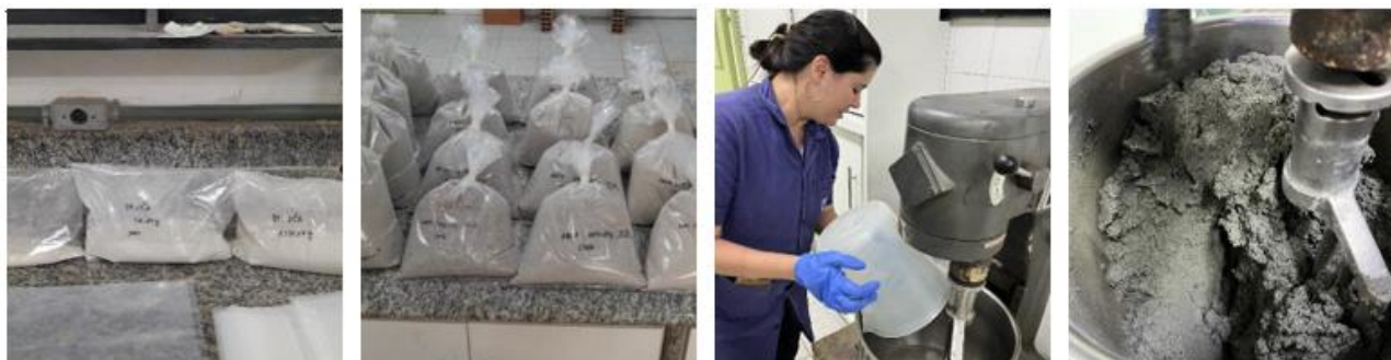
Figura 1: Teores de resíduo, fracionamento da areia e finalização da argamassa.

Na Figura 1 são apresentados os teores de resíduo, fracionamento da areia em sacos plásticos, bem como, a finalização da argamassa após o processo de mistura.