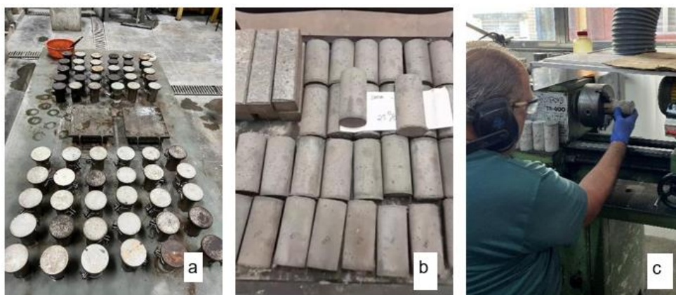
Figura 2: Moldagem, desmoldagem e retificação das amostras.

Na Figura 2 são apresentados: (a) moldagem dos corpos de prova da argamassa na mesa vibratória; (b) desmolde e identificação das amostras; e (c) retificação das amostras após a cura.