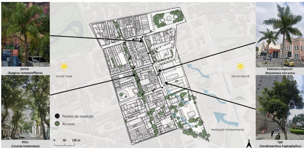
Figura 4: Mapa de arborização

Na tabela 1 estão destacados em vermelho os maiores resultados e em azul, os mais baixos, observa-se que a Avenida Gomes Freire apresenta melhores condições de conforto térmico em comparação com a Rua do Lavradio. Esse resultado está associado a maior presença de vegetação arbórea, especialmente de espécies com copas densas, como o Oiti ( Licania tomentosa ), que contribuem para a redução da temperatura do ar e melhoria das condições microclimáticas.