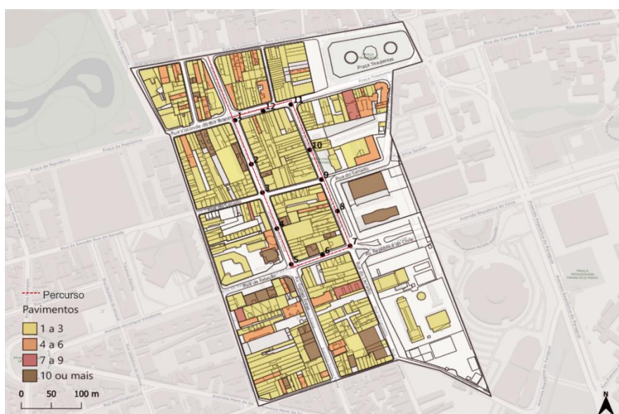
Figura 2: Mapa de gabarito

Ainda em relação à figura 2, observa-se a predominância das edificações em relação aos espaços livres. Cabe destacar, que os lotes possuem alta taxa de ocupação, sem afastamentos laterais e há prédios altos que absorvem e retêm calor, o que dificulta a presença de arborização, a circulação do ar e favorece o aumento da temperatura e os efeitos das ilhas de calor urbana que intensifica a concentração de poluentes, impactando a qualidade do ar e o bem-estar da população.