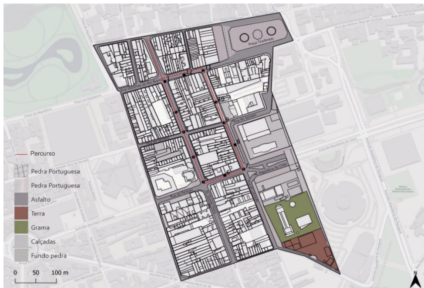
Figura 3: Mapa de materialidades

localizados na Rua Gomes Freire, com maior abundância de arborização, apresentam maiores áreas de sombra por vegetação e nesse trecho, no ponto 5 está evidenciada a menor média de temperatura do ar ao sol, 29°C.