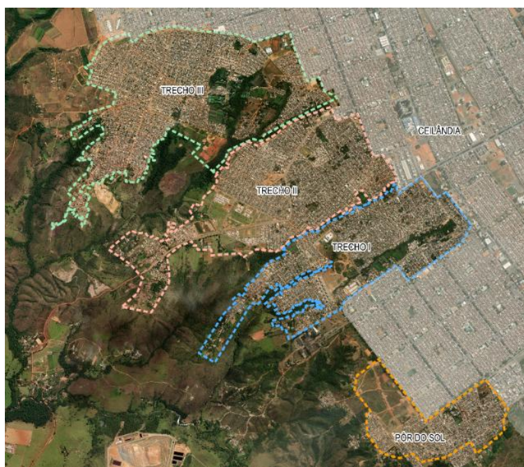
Figura 1: Localização das quatro regiões. Fonte: Autoria própria (2025).

A área de estudo abrange toda a região do Sol Nascente e Pôr do Sol, com área de 4.049,17 hectares, dividida em quatro regiões: trecho I, trecho II, trecho III e Pôr do Sol (CODEPLAN, 2021). Seu surgimento é resultado da expansão da Ceilândia, que por sua vez foi criada na década de 1970, com o objetivo de resolver o problema da falta de moradia e dos assentamentos informais existentes no Plano Piloto (Costa, 2011). A área hoje conhecida como Sol Nascente e Pôr do Sol começou a ser ocupada de forma irregular nos anos 1990, inicialmente com um total de oitenta moradias, e ao longo dos anos a região passou por um processo de ocupação intensa por conta da grilagem e do parcelamento das grandes glebas das áreas rurais (Figura 1).