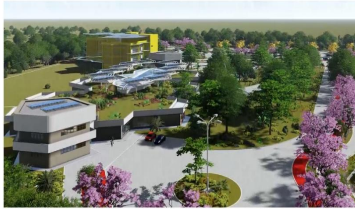
Figura 1: Renderização do Projeto do Campus Jorge Amado (UFES).

Além disso, foram incorporados sistemas construtivos ecoeficientes, como a construção seca, com redução significativa do consumo de água e geração de resíduos, bem como o uso de estrutura mista, com lajes do tipo steel deck e divisórias em chapas de placas cimentícias e gesso acartonado, visando o conforto acústico. Também foram adotadas outras soluções, como o reaproveitamento de água de chuva, o tratamento de esgoto, segregando resíduos oriundos de pias e banheiros, bem como dispositivos de medição de consumo de água (Nazário, 2022).