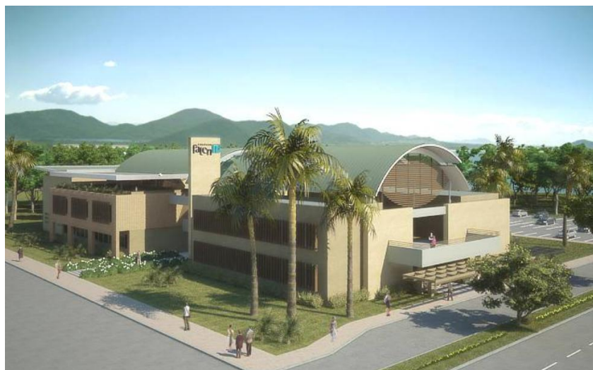
Figura 3: Renderização da Faculdade de Tecnologia Nova Palhoça (FATENP)

O projeto arquitetônico foi concebido com foco em estratégias passivas de conforto térmico e eficiência energética, priorizando o aproveitamento máximo da ventilação e iluminação natural. A cobertura do prédio principal é curva parcialmente transparente, a fim de permitir o aproveitamento da luz natural, e possui uma camada composta por material isolante termoacústico. O projeto demonstrou também preocupação com a proteção das aberturas, especialmente na fachada oeste, mais exposta à radiação solar no período da tarde. Nessa face, foram adotados elementos como brises e marquises com o objetivo de minimizar os ganhos térmicos. A figura 3 apresenta uma imagem do projeto da Faculdade de Tecnologia Nova Palhoça (FATENP), que evidencia parte das soluções mencionadas.