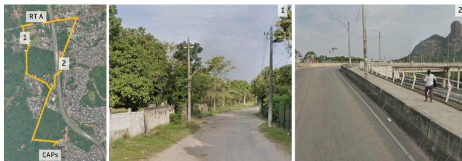
Figura 2: Percursos possíveis entre a RT A e o CAPS.

inserido próximo a uma área verde, possui trechos sem sombreamento e desconfortáveis para a caminhada.