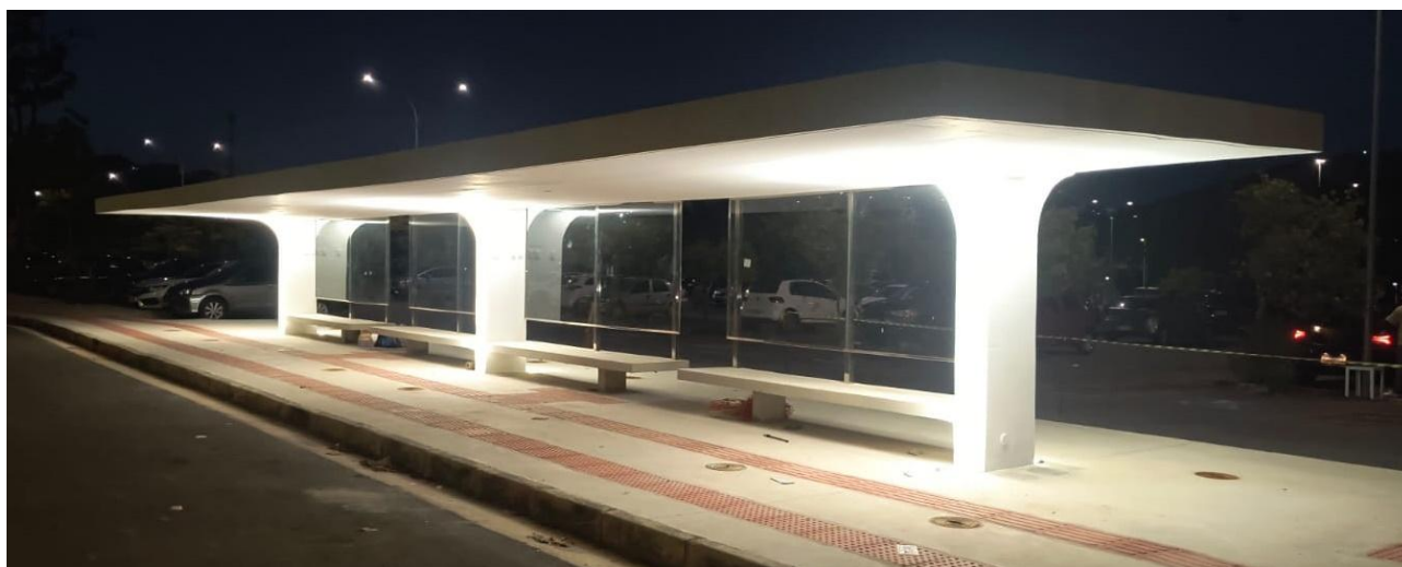
Figura 1: Abrigos de ônibus com 80 m 2 .

Os abrigos em questão foram projetados pelo renomado arquiteto Oscar Niemeyer. A área total está distribuída entre um abrigo de 56 m 2 , três abrigos de 80 m 2 , e dois abrigos maiores, com 819 m 2 e 1463 m 2 , que, além da função de abrigo, incluem também passarelas de ligação com os edifícios Minas e Gerais, que compõem o conjunto da Cidade Administrativa de Minas Gerais. A Figura 1 ilustra o resultado final de um dos abrigos menores já concluídos.