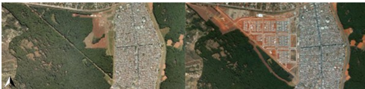
Figura 2: Espaço antes da implantação do projeto(2013) e após a construção do Residencial Paranoá Parque (2015).

Para além disso, para a construção do empreendimento houve uma grande área desmatada, como mostrado na figura 2. A não relação com espaços de áreas verdes está presente desde a concepção do projeto. Não houve nenhum cuidado com a qualidade urbana dos espaços públicos, nenhum desenho ou planejamento paisagístico, com a preservação de espécies do cerrado e manejo responsável da vegetação que antes existia ali. O foco não foi nos futuros usuários. Há grandes áreas impermeabilizadas, destinadas a vias e vagas de veículos, configurando amplos espaços, estéreis, vazios, sem sombra. Não houve uma busca pelo equilíbrio entre a interação com o meio ambiente e a promoção da justiça social.