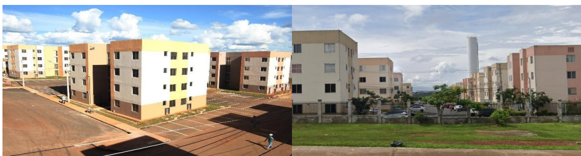
Figura 3 - Registros de blocos abertos (2014) e cercados (2025).

A urbanidade pode estar relacionada aos elementos que compõem a arquitetura, seus volumes, seus cheios e vazios e os usos que lhe são dados, assim como o meio em que está inserida. O arranjo espacial conforma encontros não programados, com a escolha da posição das aberturas, por exemplo, ocorre a definição do local de entrada e saída de pessoas, circulação e relações de vizinhança (Holanda, 2010). Com os grandes áridos vazios de estacionamentos, nenhuma rede de pequenas conformações de pontos de espaços de encontros, com a ausência de diversidade de usos, há pouco ou quase nenhum movimento em muitos locais das quadras do Paranoá Parque, configurando espaços mortos a maior parte do tempo. Desertos de urbanidade. Além das janelas das unidades do térreo ficarem muito vulneráveis, esse esvaziamento do espaço público causa insegurança e casos de violência e furto. Com isso há um movimento de cercamento dos condomínios em andamento, alguns já foram cercados, como mostra a figura 3, enquanto outros ainda estão em debate com audiências públicas sendo feitas para a decisão ser tomada. Os cercamentos têm sido feitos rentes aos blocos e sem a possibilidade de articular melhores espaços de convívio, o que vai justamente contra aos olhos das ruas de Jacob (1961) que assegurariam justamente melhor segurança.