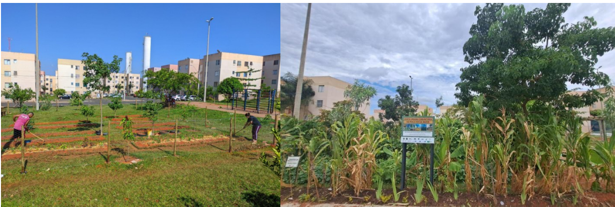
Figura 5 - Registros da área do Cantinho da Coruja em 2023, na sua implantação, e em 2025.