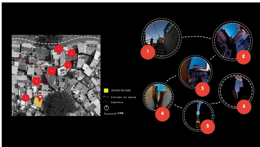
Figura 2: Fotos com lente olho-de-peixe.

Também foram feitas medições geométricas, caracterização dos materiais construtivos, e análise da orientação solar e das condições de ventilação natural. Com base nesses dados, foram elaboradas propostas de intervenção arquitetônica para qualificar as condições de ventilação e iluminação natural, respeitando os limites físicos, econômicos e culturais do contexto. As soluções projetuais foram fundamentadas tanto nos princípios de conforto ambiental quanto nas necessidades expressas pelos moradores, visando intervenções acessíveis, de baixo custo e sensíveis às dinâmicas sociais da comunidade.