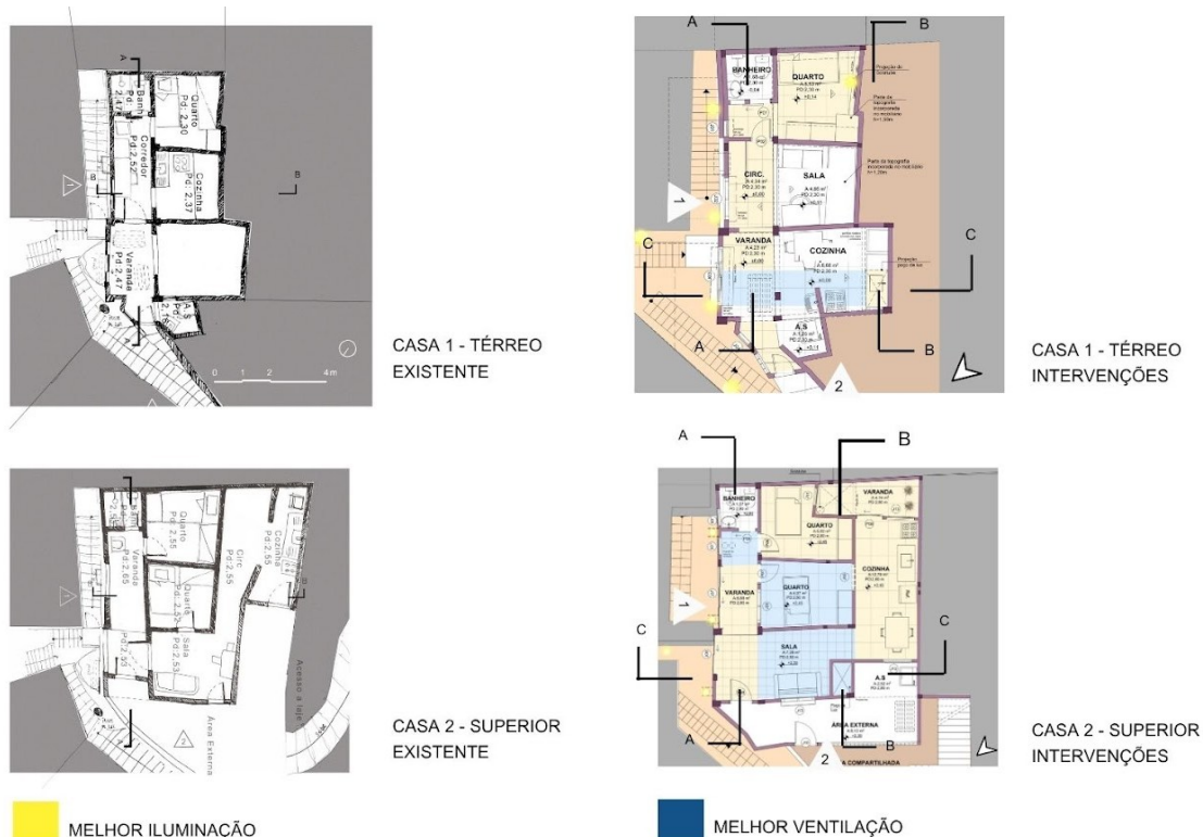
Figura 5: Plantas – Existente x Intervenção.

Na residência da Moradora 2, que possui área maior, foi possível ampliar ambientes de forma mais confortável. O quarto principal ganhou uma nova varanda para entrada de luz e ventilação, por meio de rasgo na laje superior, também com reforço estrutural. Um segundo rasgo foi feito próximo à cozinha, contribuindo para a ventilação cruzada. Além disso, foi criada uma nova área externa na fachada noroeste (Figura 5), voltada à área de serviço, aproveitando a orientação solar e garantindo maior privacidade.