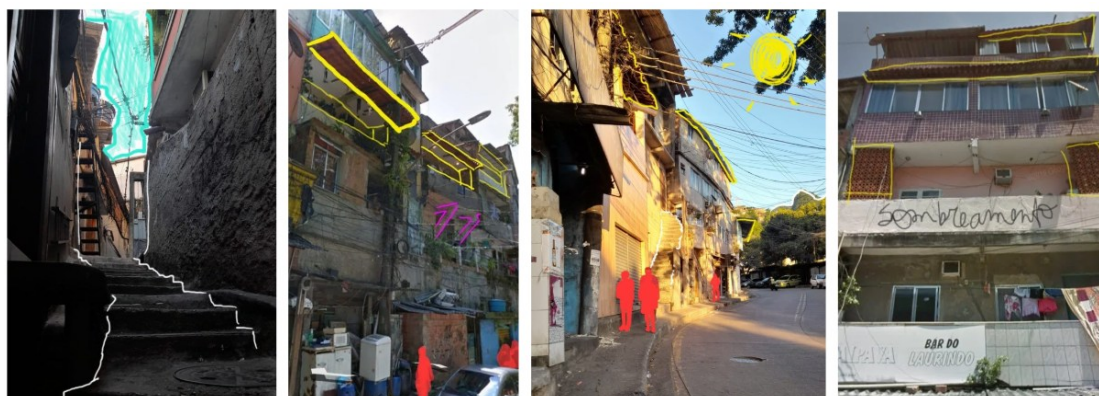
Figura 1: Registros fotográficos com intervenções gráficas.

A metodologia adotada neste estudo combinou abordagens qualitativas, exploratórias e analíticas, com o objetivo de compreender as condições de ventilação e iluminação natural em habitações localizadas em área de alta densidade urbana. O estudo foi conduzido na comunidade da Rocinha, no Rio de Janeiro, onde foi realizada, inicialmente, uma análise morfológica do tecido urbano. Essa etapa envolveu a observação direta e o registro fotográfico (Figura 1) das configurações arquitetônicas e urbanas predominantes, com foco na identificação de padrões construtivos como o número de pavimentos, os afastamentos entre edificações, a disposição e a orientação das aberturas, e o grau de enclausuramento dos cômodos. Observou-se uma relativa homogeneidade entre as construções analisadas, o que possibilitou a seleção de uma habitação representativa para aprofundamento do estudo. A residência escolhida possui dois pavimentos e apresenta situações recorrentes na comunidade, como a obstrução da ventilação cruzada e a escassa incidência de luz natural nos ambientes internos, especialmente nos cômodos centrais.