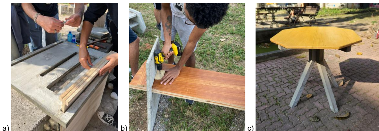
Figura 3: Montagem: a) encaixe de peças, b) aparafusamento de peças, c) montagem do objeto.