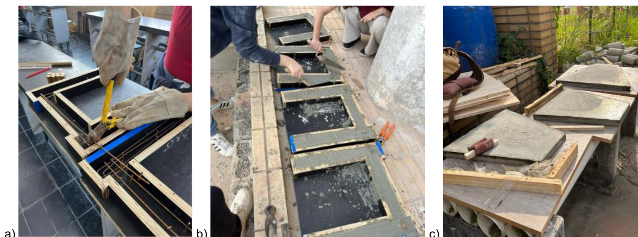
Figura 2: Execução do projeto: a) formas e armaduras, b) concretagem, c) desmoldagem.

A Figura 2 apresenta (a) a execução de formas e armaduras, (b) a concretagem das peças, e (c) a desmoldagem das peças.