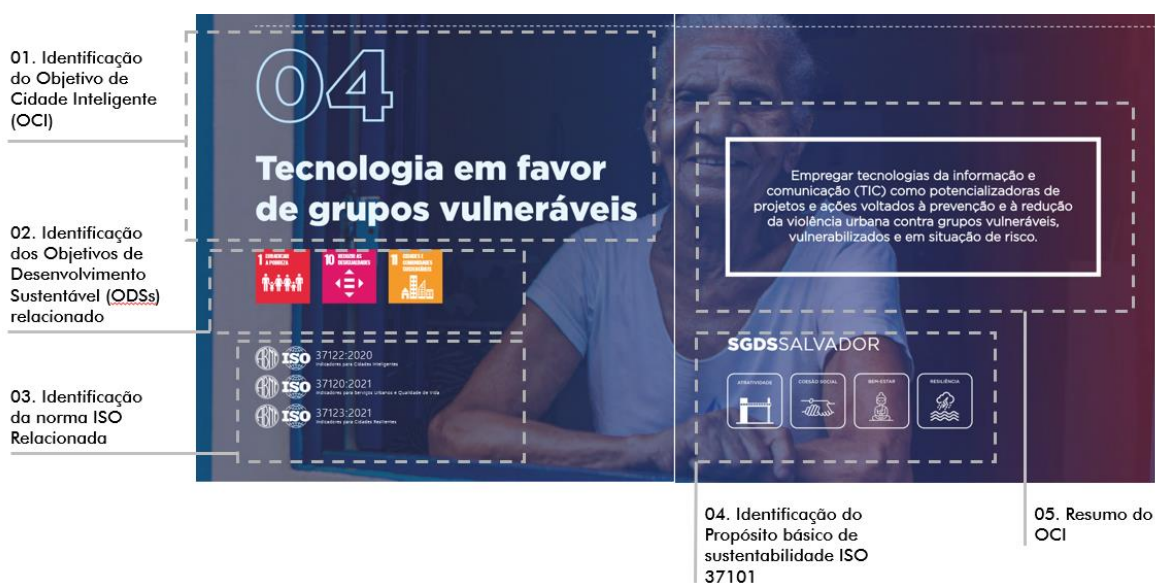
Figura 1: OCI 04 para ilustração da estrutura típica de apresentação dos OCIs do PDTCI Salvador.

Além dos ODS e das Normas ISO de Cidades Sustentáveis (37120, 37122 e 37123), cada objetivo do PDTCI está associado a um ou mais dos seis propósitos básicos de sustentabilidade definidos pela ABNT 37101 – Desenvolvimento Sustentável de Comunidades: Sistema de Gestão para o Desenvolvimento Sustentável (SGDS), sendo eles: atratividade, preservação e melhoria do meio ambiente, resiliência, uso responsável dos recursos, coesão social e bem-estar (Figura 1). Essa classificação tende a indicar que na visão adotada, uma cidade inteligente deve aprimorar os resultados de sustentabilidade da comunidade urbana, indicando que a tecnologia deve estar a serviço dessa intenção.