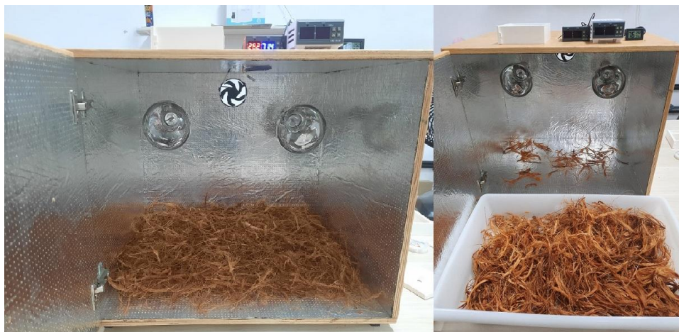
Figura 1: Fibra de coco sendo processada na estufa produzida com projeto próprio.

controladores de umidade e temperatura, capazes de desligar automaticamente as lâmpadas quando atingirem a temperatura indicada.