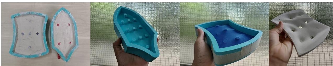
Figura 4: Moldes preenchidos com gesso, com o sistema de pinos à mostra, recoberto com tecido e a peça acústica resultante após o desmolde.

F – Na etapa de criação dos produtos finais, foram concebidas geometrias para as peças acústicas individuais que, em conjunto, formam um mosaico geométrico articulado, ao se encaixarem. Assim, diferentes geometrias de peças estão sendo exploradas. Nesse momento, as dimensões de cada peça estão sendo ampliadas, mas ainda em pequena escala, para que possam ter os moldes impressos 3D na mesma máquina. Isso tem permitido mais liberdade de geração dos desenhos dos moldes, que tem incluído sistemas de pinos na base para gerar variações formais em conjunto com tecidos e borracha látex. Esse processo tem permitido testes dimensionais, da relação entre quantidade de material e de peso, além de ajustes nas geometrias. Para essas peças, utilizou-se a fibra de coco no comprimento de 40 mm.