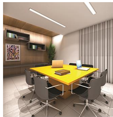
Sala de Estudos