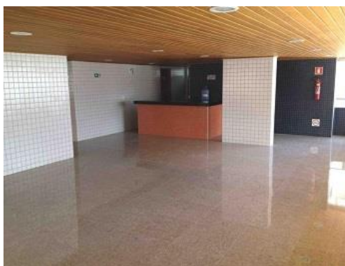
Salão de festas

Os ambientes piscina infantil, do grupo lazer infantil, e piscina adulto, do grupo lazer adulto, separados por um septo de alvenaria, ocorrem no pavimento térreo/pilotis. O ambiente salão de festas, do grupo lazer compartilhado, ocorre no pavimento mezanino (Figura 4).