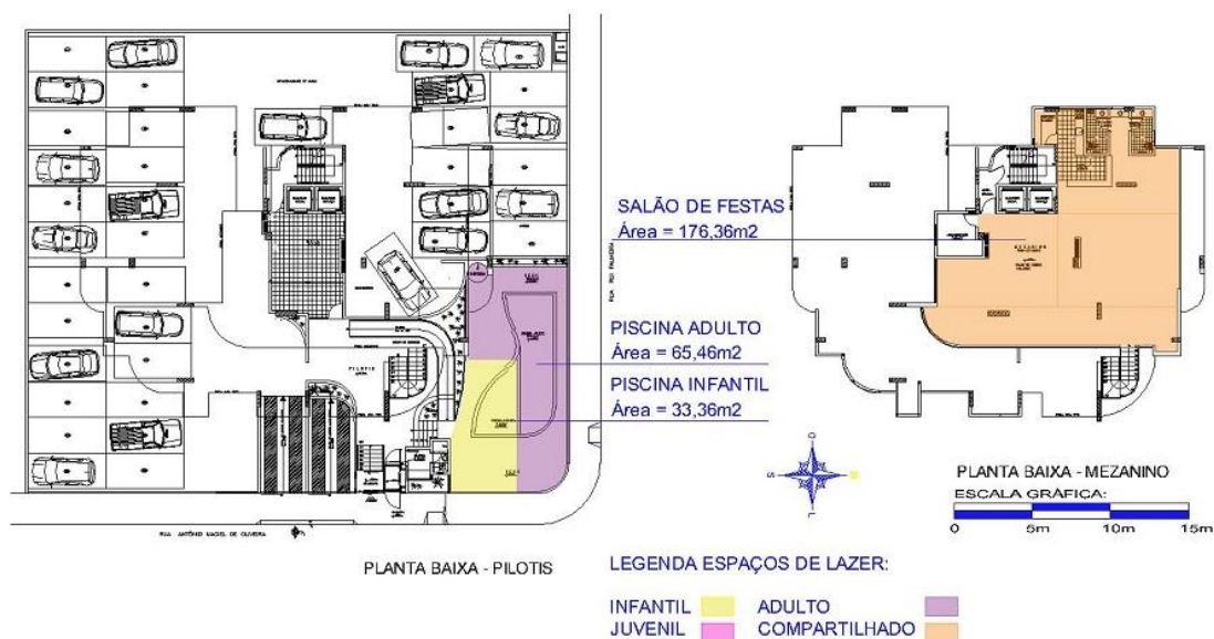
Figura 3 – Plantas do pilotis e do mezanino do edifício Cádiz