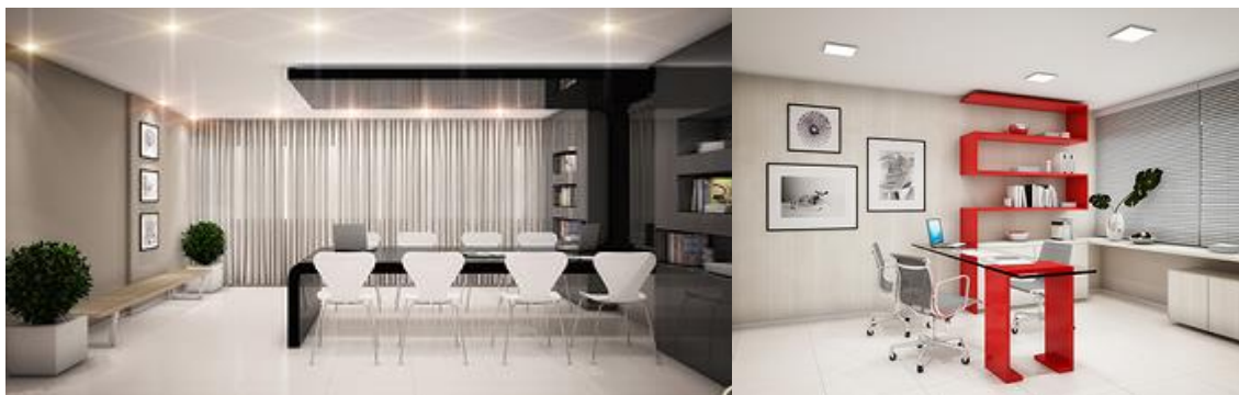
Sala de Estudos