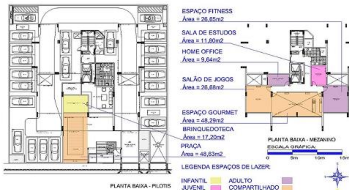
Figura 1 – Plantas do pilotis e do mezanino do edifício Double