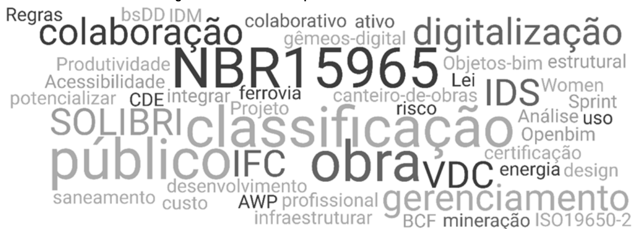
Figura 1: Temas em destaque no BIM Conference de 2023.

No Brasil, a partir do Decreto que estabeleceu a estratégia BIM-BR (Decreto 9833, 2019), o interesse no tema cresceu e levou à criação do BIM Fórum – uma associação civil de âmbito nacional, neutra, sem fins lucrativos que reúne os diversos agentes da cadeia produtiva da construção envolvidos e interessados na disseminação do conceito e prática da Modelagem da Informação da Construção (BFB, 2024). Desde 2023 o BIM Fórum tem promovido o evento internacional BIM Conference. A nuvem de palavras construída a partir dos temas divulgados na programação do primeiro evento (Figura 1), permite identificar que o destaque desta edição foram as discussões sobre a norma NBR 15965, que trata do sistema de classificação da informação. (BIM Conference, 2023).