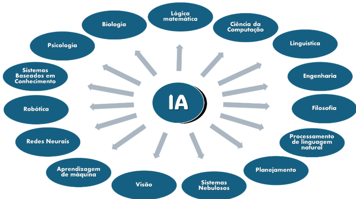
Figura 4: Áreas relacionadas com a Inteligência Artificial.