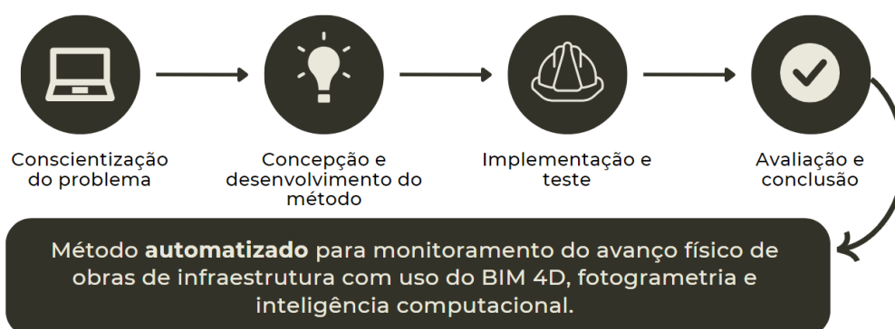
Figura 1: Delineamento da Pesquisa.

Esses dados foram analisados qualitativamente para identificar barreiras e oportunidades práticas para a aplicação de sistemas automatizados de monitoramento de progresso. Com base nessa abordagem, o estudo estrutura-se em quatro etapas: (1) conscientização do problema; (2) concepção e desenvolvimento do método; (3) implementação e teste; e (4) avaliação e conclusão. Este artigo apresenta os resultados parciais da pesquisa, com foco na etapa de conscientização.