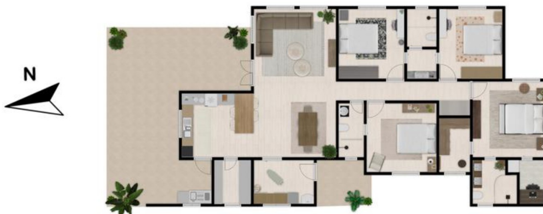
Figura 2 – Planta baixa da edificação (sem escala)